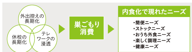
▲コロナ禍で生まれた消費者行動とニーズの変化

新型コロナウイルス感染症拡大の影響で、働き方や余暇の過ごし方など生活スタイルが大きく変化する中、家庭で過ごす時間が増え、内食頻度の増加とともに、家庭内調理や喫食シーンにおける新たなニーズが生まれています。